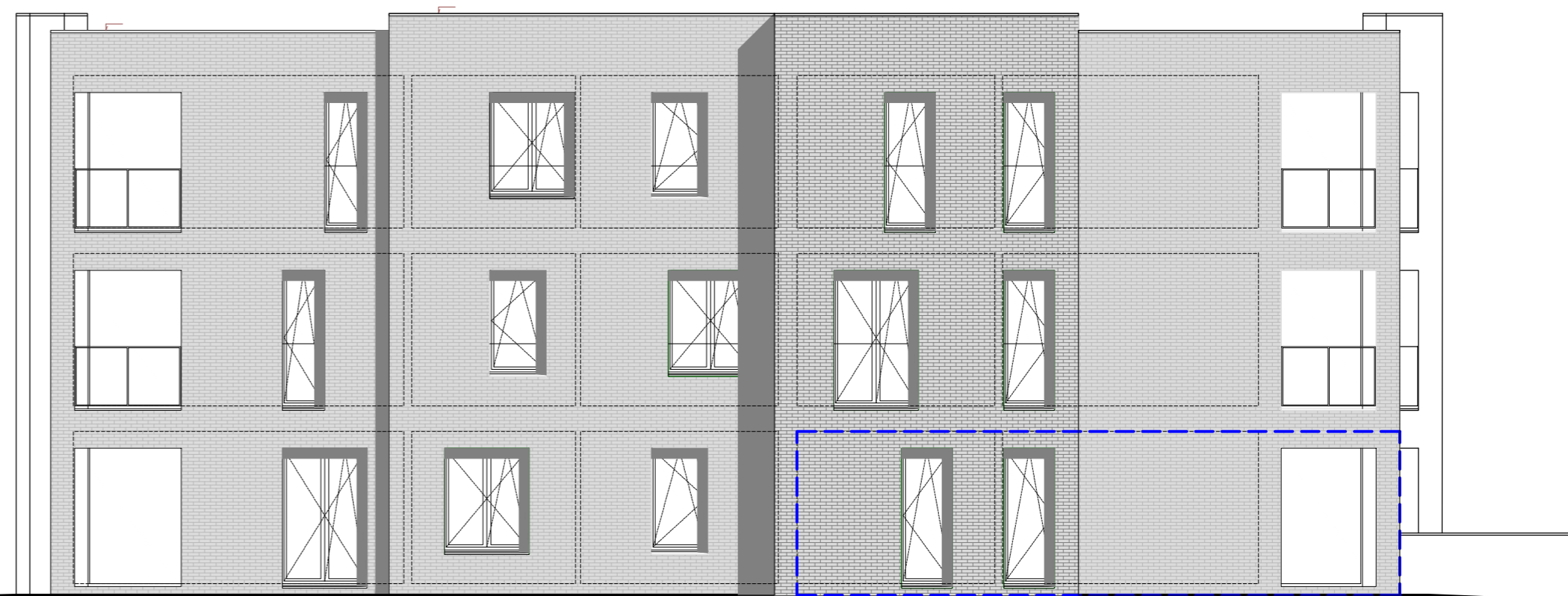
Zuid-West gevel 1:100