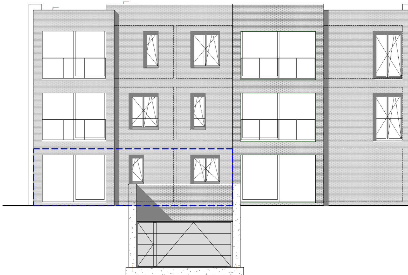
Zuid-Oost gevel 1:100